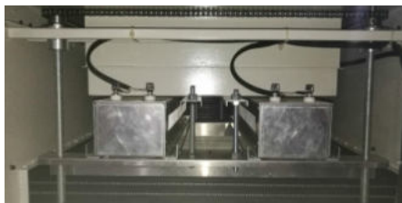
2 металлогалогенные лампы