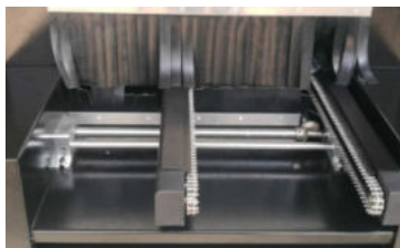
Конвейер с тефлоновой сеткой или цепью из нержавеющей стали, который позволяет легко использовать машину, как в линии, так и вне ее