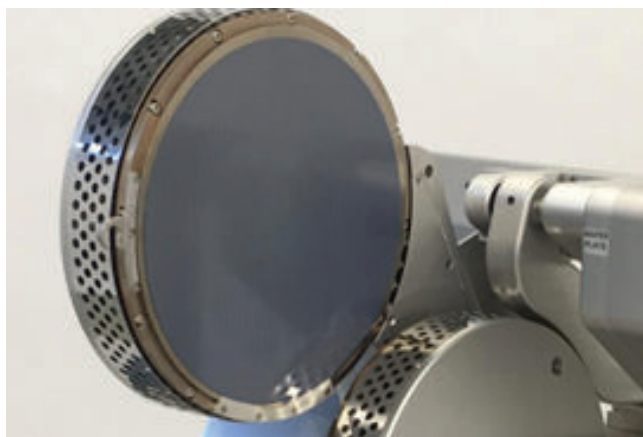
Термостол для носителя